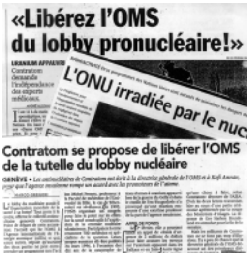
Titulares publicados en los diarios europeos

A la señora Gro Harlem BRUNDTLAND Ginebra, 12 de febrero de 2.001