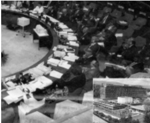
Asamblea General de la OMS